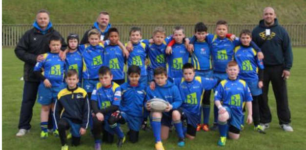
Marcq en Baroeul